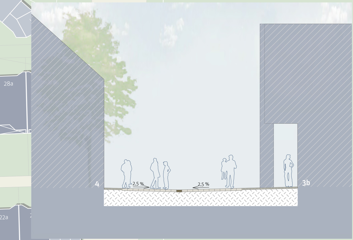
Schnitt C - C | M 1:100